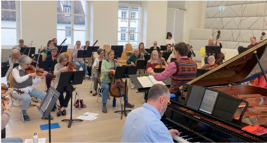
Das Philharmonische Orchester Basel zusammen mit Filippo Gamba bei der Probe für das Konzert im November 2025 im Stadtcasino Basel